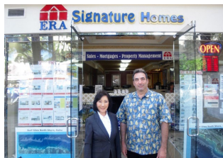
ERA Signature Homes (オフィス)

ERA (Electronic Realty Associates) は、ITを駆使し、日本国内だけでなく、世界52の国と地域に広がる国際ネットワーク。 1971年にアメリカで誕生して以来、世界の不動産業界で革新的リーダーとしての役割を担っています。イーアールエー・ジャ パンは、日本初のマスターフランチャイジー (FC) として1981年に発足し、全国にネットワークを広げてまいりました。住宅・ 不動産の売買や賃貸、そして建築・リフォームまで住に関する幅広いサービスを提供できる「住生活総合サービス業」への発 展を通じてお客様のお役に立つよう動いております。