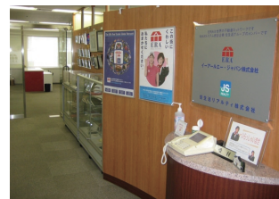
LIXILイーアールエージャパン (東京)